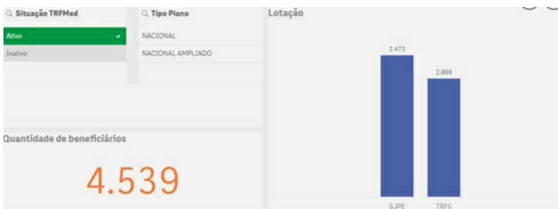
Figura 1 – Total de beneficiários extraído do Portal de Business Intelligence da 5ª Região – Relativos ao total de beneficiários do TRFMED para a Sede do Tribunal e a Seccional de Pernambuco

6.1 – O Serviço de Atenção Domiciliar – SAD será posto à disposição de todos os beneficiários do TRFMED no estado de Pernambuco, os quais totalizam, no momento da realização do presente estudo, 4.539 (quatro mil, quinhentos e trinta e nove) beneficiários.