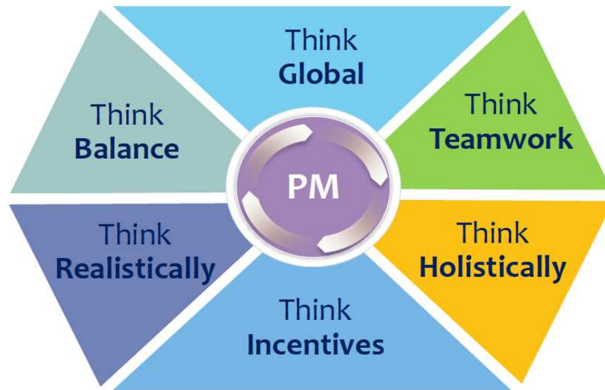
Figura 1 – How to think like a project manager (WU, Te., 2013)

pensar e sentir como um gerente de projetos, algo que envolve mais do que gerenciar a famosa tripla restrição.