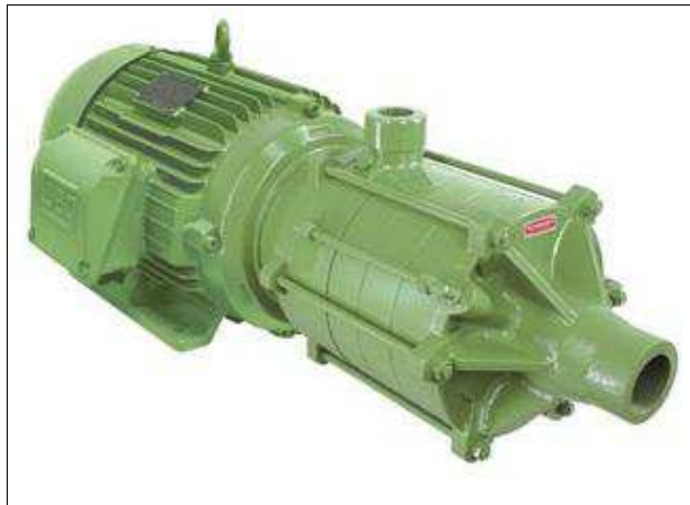
Imagem do equipamento de referência:

3.2. Uma bomba centrífuga monoestágio Schneider BC-21 R 10CV ou similar com as seguintes características: