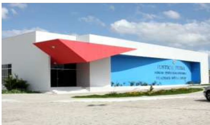
Fórum Desembargador Federal Vladimir Souza Carvalho

O Fórum Desembargador Federal Vladimir Souza Carvalho, terceiro da Seção Judiciária, abriga a 6ª Vara Federal e fica sediado na cidade de Itabaiana, na Rua Maria de Souza Carvalho, no bairro Marianga, próximo à BR-235. O prédio pertence à União e comporta bem a Subseção Judiciária de Itabaiana.