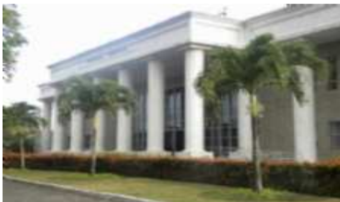
Fórum Ministro Geraldo Barreto Sobral

O prédio onde funciona o Fórum Ministro Geraldo Barreto Sobral pertence à União e foi edificado com a finalidade de abrigar a Seção Judiciária de Sergipe.